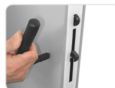
Key to tighten the camlocks