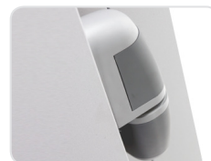
Special hinge with slope